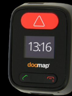
Boitier GSM - GPS D-200