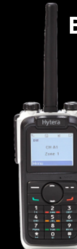
Boitier radio D-300