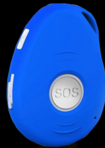
Boitier GSM - GPS D-50