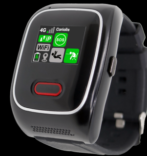
Boitier GSM - GPS D-100